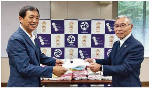
退職公務員連盟 行方・潮来支部様

心温まるお気持ちをお寄せくださいます。誠にありがとうございます。お預かりした善意は社会福祉向上のために活用させていただきます。