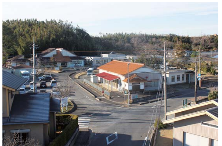
▼現在の社協（黄色い屋根の建物の奥）町並みは 変わったが道路のかたちはそのまま残っている。