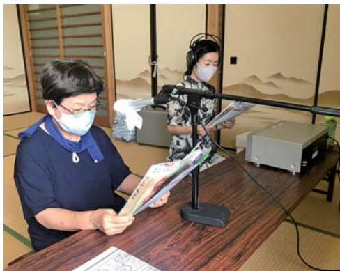
▲専用の機材を使用し、リスナーに聞き取りやすいよう、細心の注意を払って録音に臨んでいます。

録音されたCDやカセットは福祉事務所や図書館、社会福祉協議会で貸し出しておりますので、ぜひ一度聞いてください。