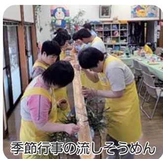
季節行事の流しそうめん