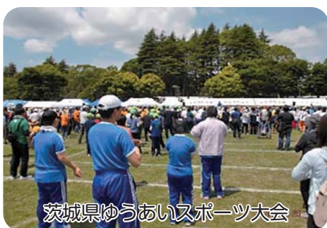
茨城県ゆうあいスポーツ大会