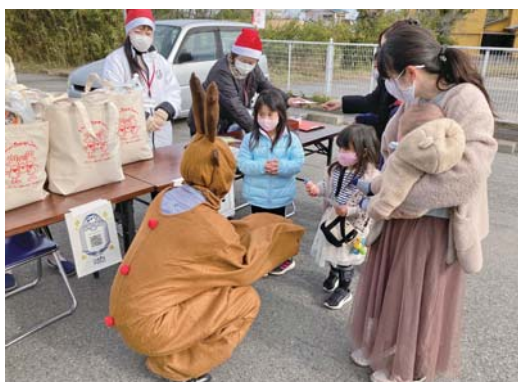
▲当日は、お子様連れで多くの方に来所いただきました。

イベントの中で集計したアンケートをもとに今後、市内で子ども食堂の立ち上げの参考にさせていただきますので、ご期待ください。